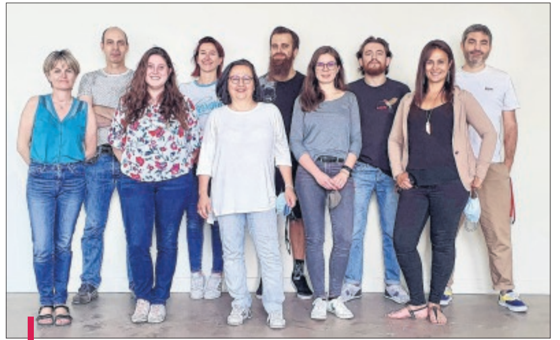
L'équipe du NeuroCyto Lab de La Timone a remporté la médaille d'argent du Nikon Small World avec son condensé de 12 heures de vie cellulaire.

Le film récompensé mardi dernier n'est en fait qu'un exercice de style pour le laboratoire marseillais, une manière d'illustrer leur savoir-faire au microscope. Le véritable objet d'étude de l'équipe NeuroCyto n'est pas la cellule de base mais les neurones, plus précisément les neurones en action. "Notre problématique, c'est d'étudier à l'intérieur d'une culture de neurones comment ils se forment, se connectent, interagissent...", poursuit le chercheur. Ce qui passe donc par de la microscopie sur cellules vivantes, dans