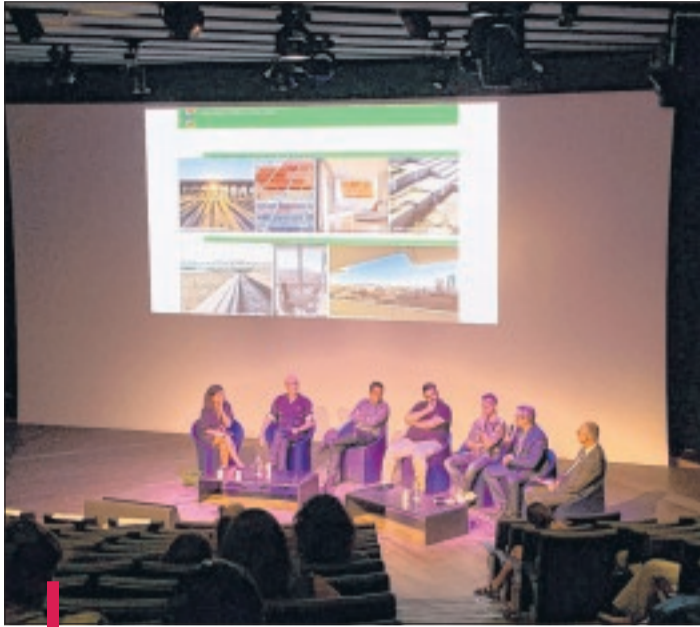
La troisième édition du festival des "Sciences et des Arts" a débuté hier au Mucem.

La Méditerranée, la star de l'été. Dès les premières chaleurs, les Français se pressent pour s'y baigner. Seulement, pour les Marseillais, elle est bien plus que cela et représente l'histoire. Alors, quel autre sujet aurait pu occuper la troisième édition du festival des "Sciences et des Arts" organisé par Aix-Marseille université ?